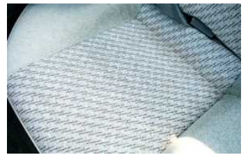
④乾燥まで約2～3時間 待ちます