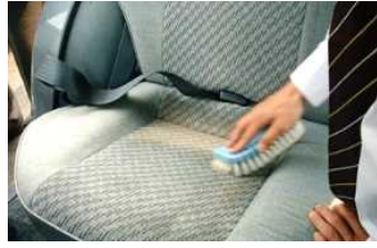
②汚れがひどい場合には、 専用洗剤を噴霧後、 軽くブラッシングし、 汚れを浮かします。