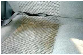
①洗淨前のシート 飲みこぼしの汚れで 汚れています。