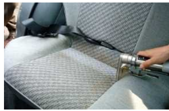
③シートを洗淨します 素早く2～3回程度 往復させます。