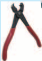
リムーバルプライヤー付

型 式 : NEX-2000DS 寸 法 : 280×127×127mm 本 体 重 量 : 1.4kg 空 気 使 用 量 : 142L/min エアー圧力 : 0.62MPa 騒 音 : 96 db(A)