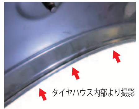
タイヤハウス内部より撮影

パネル厚に調整したヘミングツールを パネルに沿って通すだけで簡単に取り扱えます。