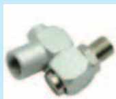
スイベルコネクター付き