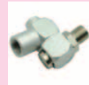
スィベルコネクター付き