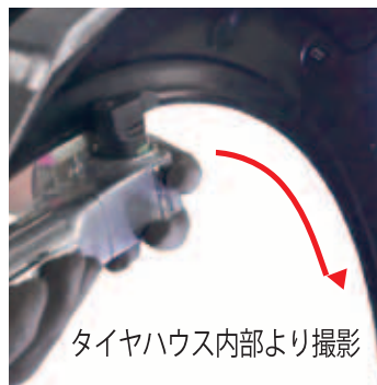
タイヤハウス内部より撮影

パネル厚に調整したヘミングツールを パネルに沿って通すだけで簡単に取り扱えます。